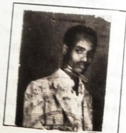
መም/ ወርቅአገኘሁ ጋ/ጊዮርጊስ ቆንጆ ሚስትህን ጥሰሁ...