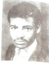
መም/ አሰረሰ ከግ