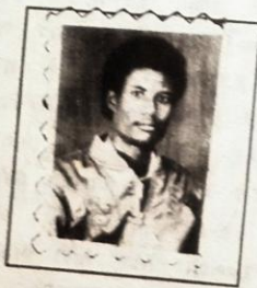
መም/ መሰለ ወንድሙ ትልቅ ባልሆነም...