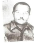
ወታደር ቦጋለ መኮንን