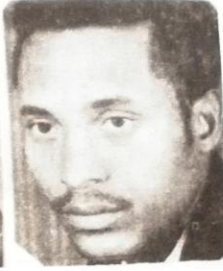
ወታደር ተካ መኮንን