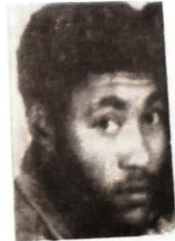
ወታደር ምኒልክ ገደሉ