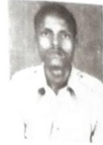
ወታደር አላላ ሰይጣን