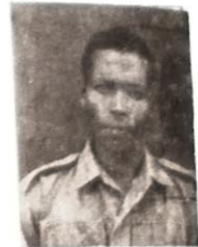
ወታደር ገዳሱ ጉሳ