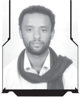
ጠቅላይ ሚኒስትር ጠቅላይ ሚኒስትሩ ጠቅላይ ሚኒስትሩ ጠቅላይ ሚኒስትሩ

ጠቅላይ ሚኒስትር ጠቅላይ ሚኒስትር ጠቅላይ ሚኒስትሩ ጠቅላይ ሚኒስትሩ ጠቅላይ ሚኒስትሩ