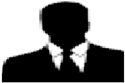
ወርቅነህ ማሞ ተሰማ