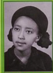
ቅንጅት ናደው Konjiu Nadew