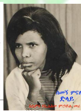
ከመኝ ምናለ ደ.ላይ