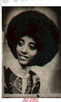
ዝርገ መጻሕፍት Melle Mezmara