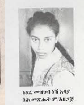
652. መዝገብ ነሽ አባያ ነሕ መጽሐት ም/አዘጋጅ