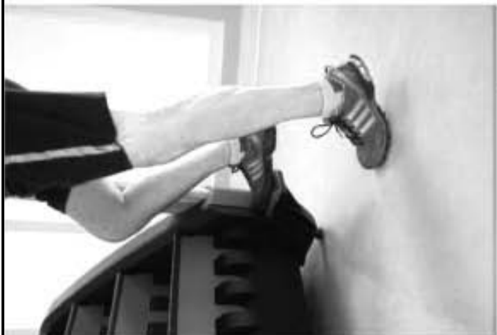
• ፓወር ሚል ሰፊ የደረጃ መረጃ መረጃዎች እና ምቹ መወጣት።