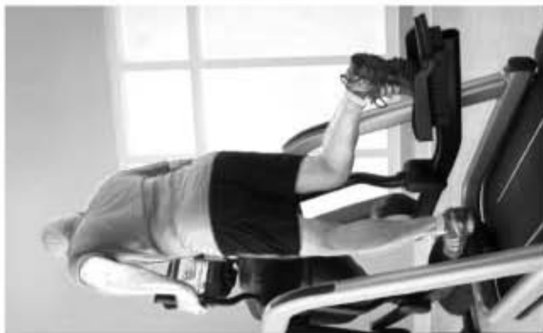
• ፍላክስ ስትራይድ ለመሬት ቅርብ የሆነ መረጃ።

• ፓወር ሚል የደረጃ እንቅስቃሴ መሳሪያ፣ በላቀ ምቹት የተለያዩ አድራሻዎች እና አቅም ላላቸው ተጠቃሚዎች።