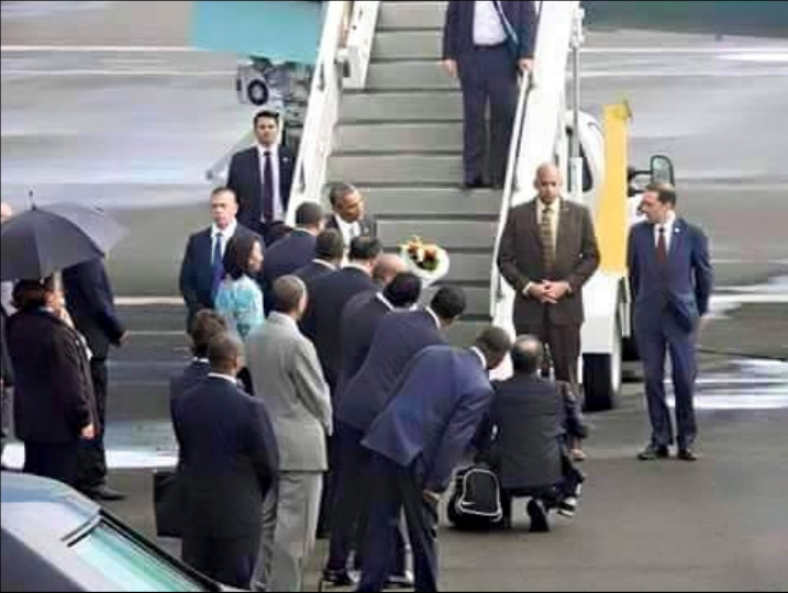
ይወቀው። (ትዕይንቱ ቀጥሏል)

ፕሬዝዳንት ባራክ ኦባማ ከአውሮፕላን ሲወርዱ ቀይ ምንጣፍ ተዘጋጅቶ አልጠበቃቸውም። ትንሽ ቆይተው ጠ/ሚ ኃይለማርያም ደሳለኝ ቀይ የቃልቻ የሚመስል ጃንጥላ ተይዘላቸው ወደ አውሮፕላኑ መጡ። ከሳቸው በፊት ቆሙ የሚጠብቁትን ጥቂት ሚንስትሮቻቸውን ቀና ብለው እንኳን ሳያዩ ወደ አውሮፕላኑ ስር ተጣድፈው ደረሱ። ፕሬዝዳንት ባራክ ኦባማ ከአውሮፕላኑ ወርደው ሳይጨርሱ፤ ህጻናቱ አበባ ለመስጠት አሰፈሰ። አንድ ሳይሆን ሁለት አበባ ይዘዋል። ሁለተኛው አበባ ለማን እንደሆነ አምላክ