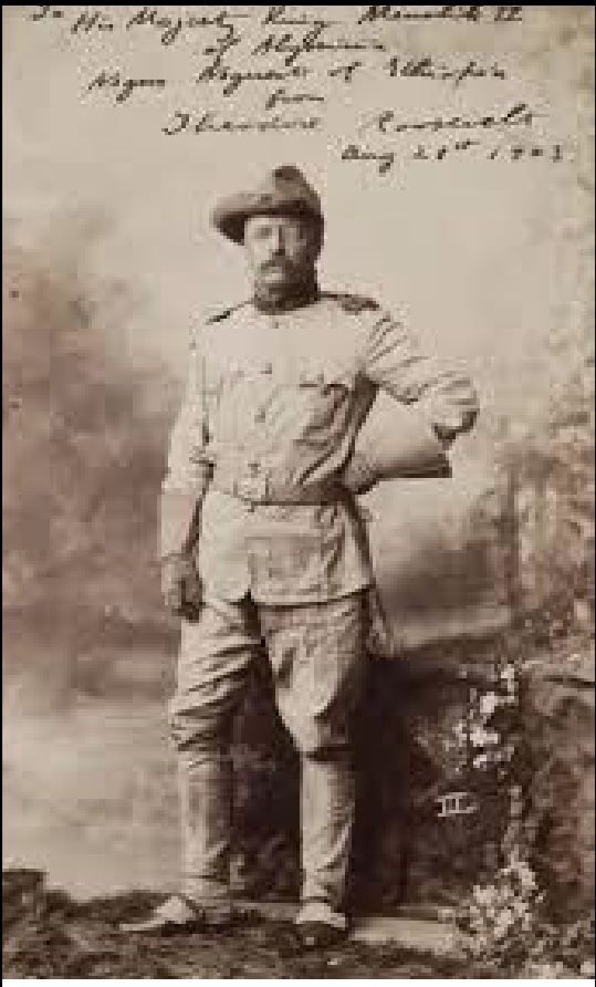
ይህ ፎቶ የተላከው ከታዋቂው የአሜሪካ ፕሬዝዳንት ቴዎዶር ሩዝቤልት፤ ለአጼ ምኒልክ ነው። ከላይ ያለው ጽሁፍ ቃል በቃል - To His Majesty King Menelik II of Abyssinia. Niguse Negest of Ethiopia. From Theodore Roosevelt. ይላል።

እንዲህ እንዲህ እያልን... ጥቁሮች የኒቨርስቲ መግባት በማይችሉበት ወቅት እንመላኩ በየን አሃዮ የኒቨርስቲ እንዲገቡ ያደረጉትን የአሜሪካውን ፕሬዝዳንት ዋረን ሃርዲንግን ጭምር ማንሳት አስፈላጊ ነው። በአንድም ሆነ በሌላ መንገድ የአሜሪካ ፕሬዝዳንቶች ልባቸው ኢትዮጵያን ሲያስብ ኖሯል። በኢትዮጵያ እና ጣልያን ጦርነት ወቅት አለም ሁሉ ፊቱን ሲያዞርብን፤ የጣልያንን ወረራ ካልተቀበሉት አምስት አገሮች ውስጥ አሜሪካ አንዷ ነበረች። በኢትዮጵያ ውስጥ ግዙፍን አየር መንገድ እና የቀድሞውን አውራ ጎዳና መስሪያ ቤት የመሰረቱት አሜሪካኖች ናቸው። በ1963 ዓ.ም. ቀዳማዊ ኃይለስላሴ አሜሪካንን ሲጎበኙ፤ ፕሬዝዳንት ጆን ኤፍ.ኬኔዲ ተቀብለው አስተናግደዋቸዋል። ኋይት ሃውስ በከብር የገቡትም የመጀመሪያው ጥቁር መሪ፤ ቀዳማዊ ኃይለስላሴ ሆነዋል። አሜሪካኖች ከመልካም ዲፕሎማሲያዊ ግንኙነታችን በተጨማሪ ተዋጊ መርከቦችን ጨምሮ፤ የሰጡን የጦር መሳሪያ እና የጦር ልምድ የትየለሌ ነው። ይህን ሁሉ ወደ ጎን ብንተው እንኳን፤ በ19ሰማንያዎቹ የድርቅ ዘመናት ከሌላው ህዝብ በላይ "We are the world" ብለው የታደጉትን ከቶ አንረሳውም። አለም በአውሮፕላን መቀራረብ ከጀመረች በኋላ የቀድሞዎቹ የአሜሪካ ፕሬዝዳንቶች ጂሚ ካርተር፤ ቢል ክሊንተን እና ጆርጅ ቡሽ በተደጋጋሚ ኢትዮጵያን ጎበኝተዋል። አሁን ደግሞ ፕሬዝዳንት ባራክ ኦባማ ኢትዮጵያን ጎበኙ። ከዚያ በፊት የሆነውን አብረን እንከታተል።