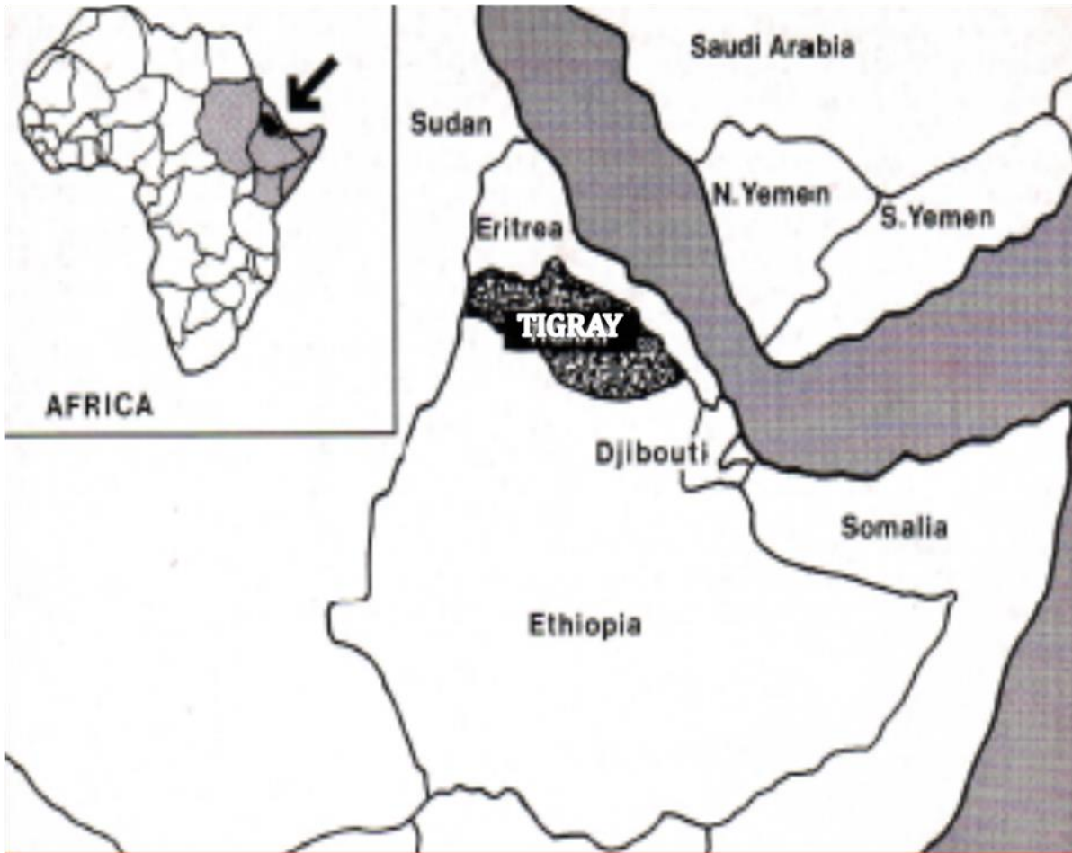
ካርታ ቁ. 2

• Location. Tigray is situated in the northern part of Ethiopia. On the north and east, it is bounded by Eritrea; on the south by Wello and southwest by Gondor regions; and on the west by Sudan