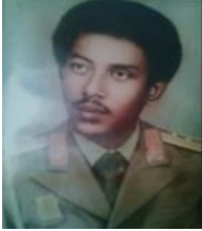
( ከሺቫ ሚኒሊክ አምስተርዳም ፣ 14/4/2017))